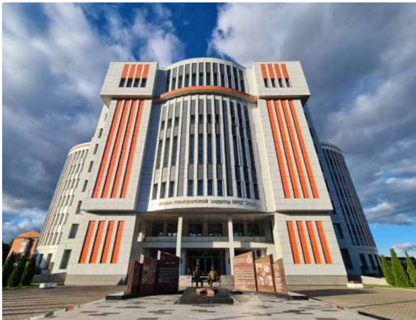
Направления подготовки высшего образования за счет средств федерального бюджета и на базе среднего общего и среднего профессионального образования (очная форма обучения, квалификация «бакалавр» – курсанты)